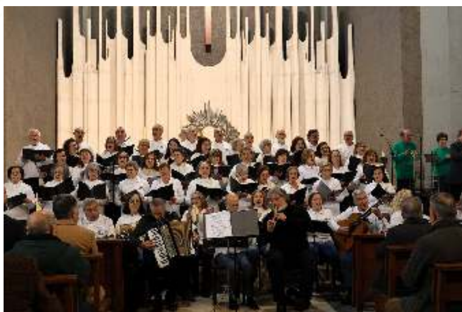
Cantares ao Menino.