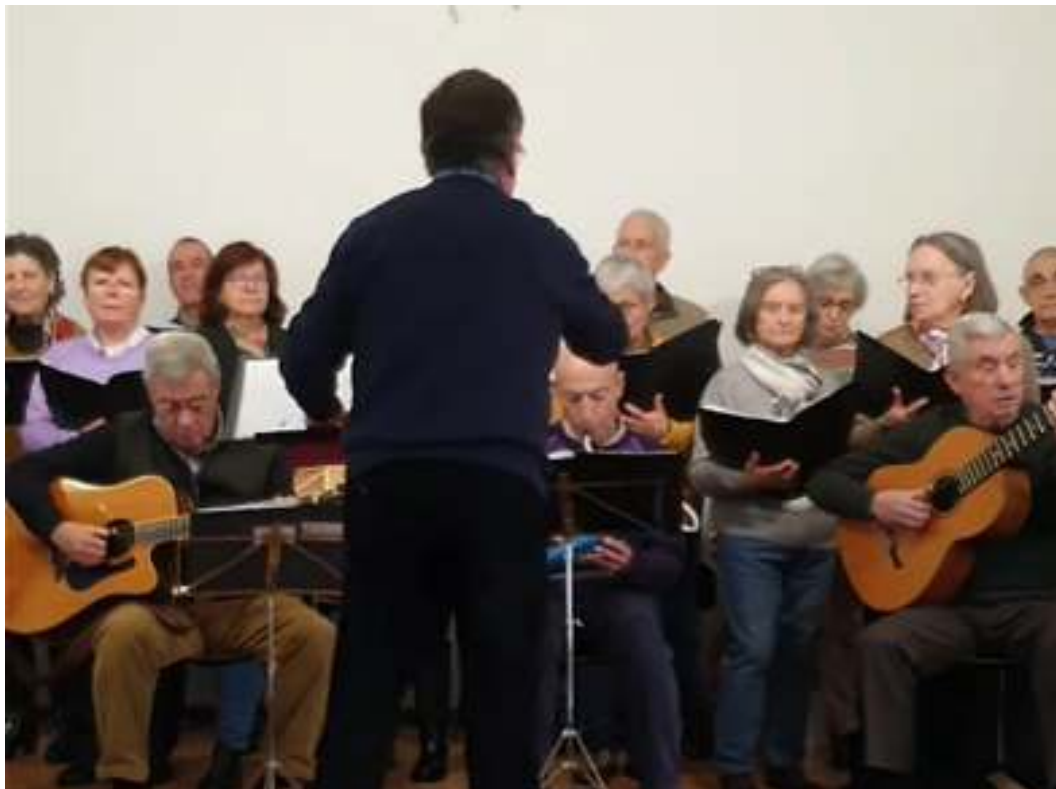
Cantar as Janeiras na Casa do Povo.

popular como elemento de união entre gerações e instituições, encerrando-se a visita com um gesto de carinho dos anfitriões, partilhado por todos.