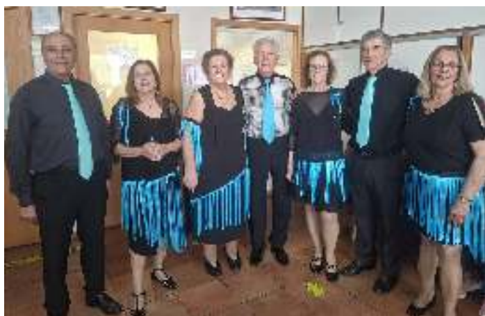
Grupo de Danças de Salão da USE.