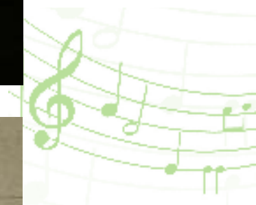
Cantares ao Menino.