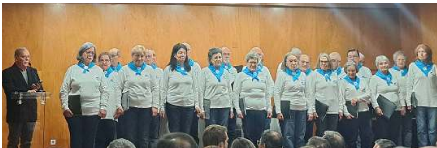
Grupo Cante Norte, da Universidade Sénior de Ermesinde.

O encontro encerrou com nova intervenção musical, desta vez pelo Curso de Música da Associação Académica e Cultural de Ermesinde. ■