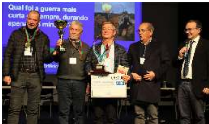
Universidade Sénior de Ermesinde vence Concurso de Cultura Geral.

O início do ano ficou assinalado por iniciativas de forte pendor tradicional e comunitário, como o Cantar as Janeiras, que percorreu várias instituições locais, levando música, proximidade e solidariedade a diferentes públicos, com especial incidência em espaços de apoio social. Ainda no âmbito das tradições, o concerto “Cantares ao Menino” reuniu centenas de pessoas na Igreja Matriz, afirmando a importância da música enquanto elemento agregador da comunidade.