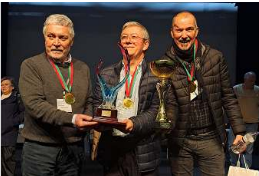
Equipa campeã da Universidade Sénior de Ermesinde.

A prova decorreu em três fases – duas semifinais e uma final – culminando num momento de grande emoção, com as equipas de Ermesinde e Gondomar a terminarem empatadas. A decisão foi encontrada através de uma pergunta de desempate, que consagrou a equipa da casa como vencedora desta edição. O terceiro lugar foi alcançado pela Universidade Sénior de Vila Franca de Xira.