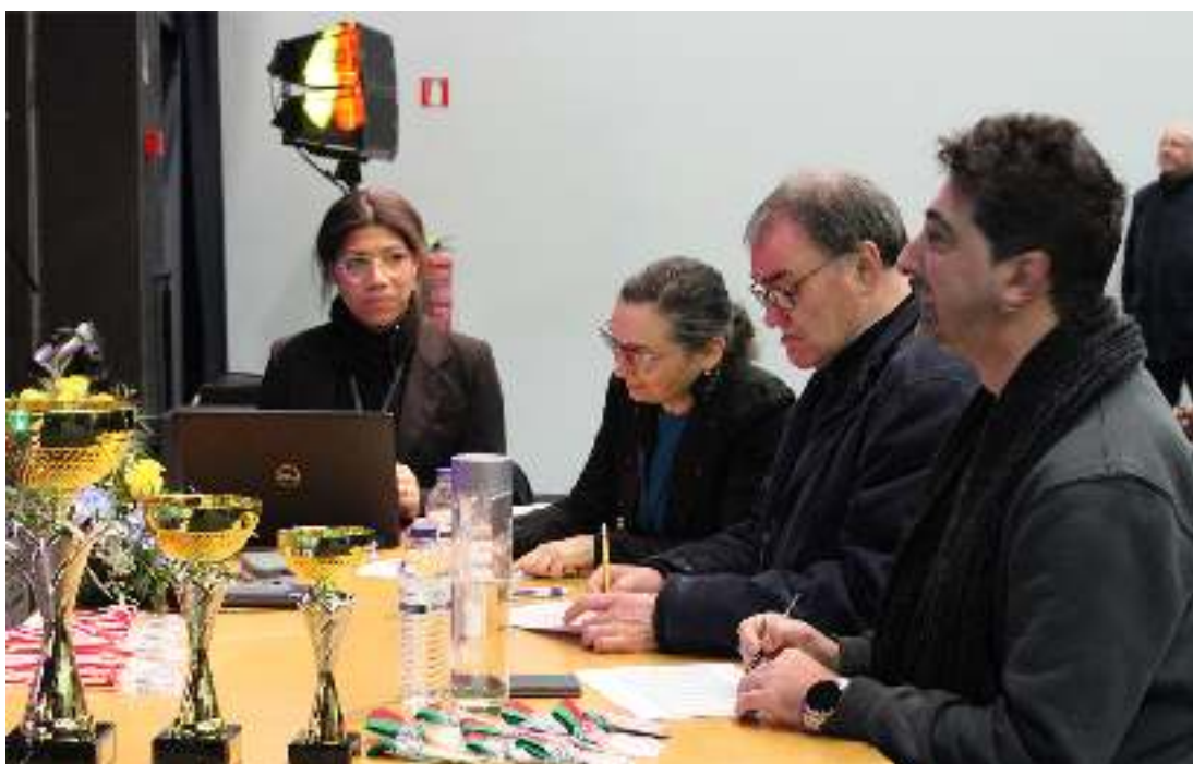
Júri do Concurso Nacional de Cultura Geral.