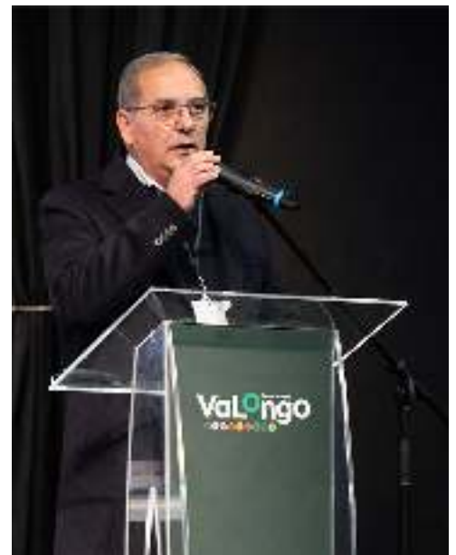
Presidente da Direção da Agorárte.