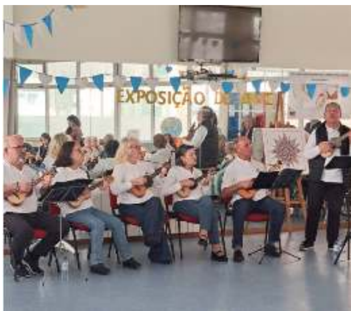
Grupo de Cavaquinhos da USE.