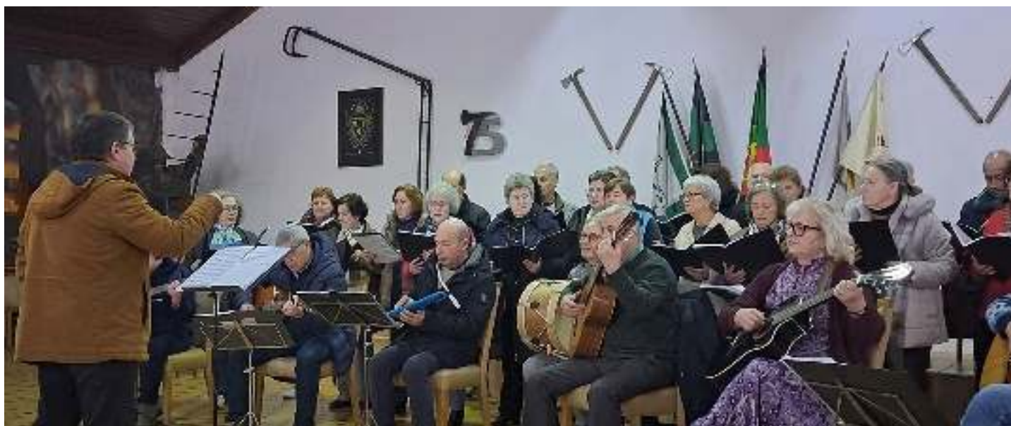
Cantar as Janeiras – Bombeiros Voluntários de Ermesinde.

vido ao serviço da população. A receção calorosa por parte da direção da corporação transformou o momento num verdadeiro encontro de gratidão e respeito mútuo.