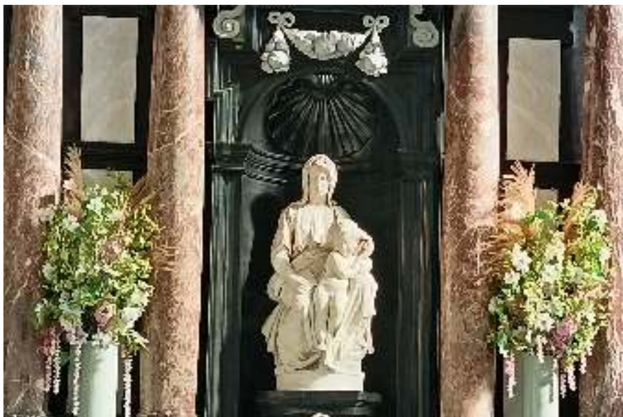
“Madona com o Menino”, de Miguel Ângelo.