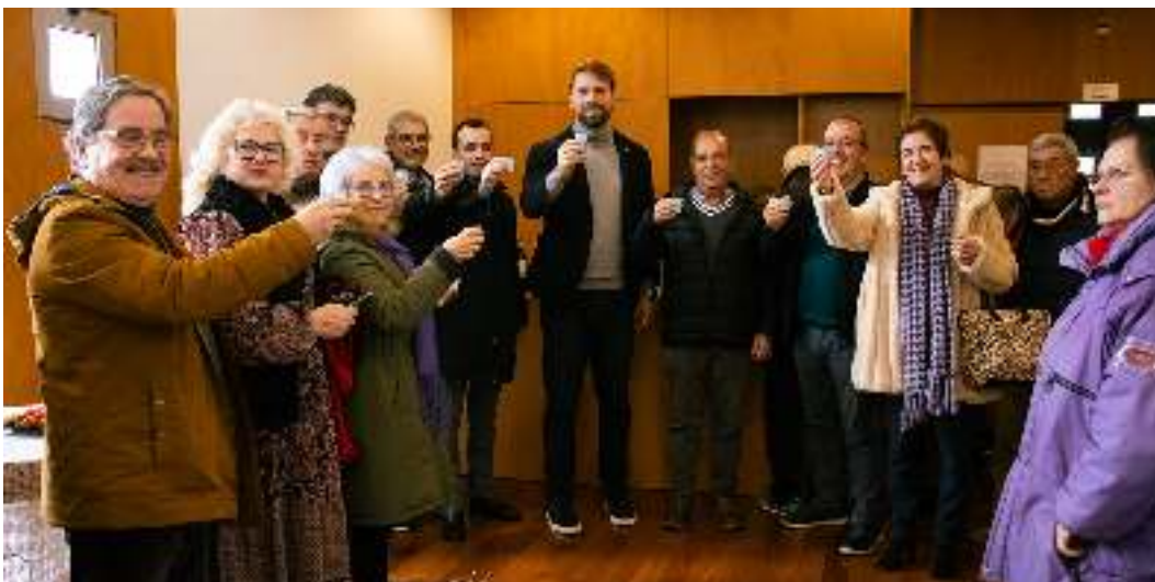
Cantar as Janeiras – Junta de Freguesia de Ermesinde.

houve espaço para a participação espontânea dos anfitriões e para um convívio animado, à volta de bolo-rei e vinho do Porto, num ambiente de proximidade e celebração das tradições.