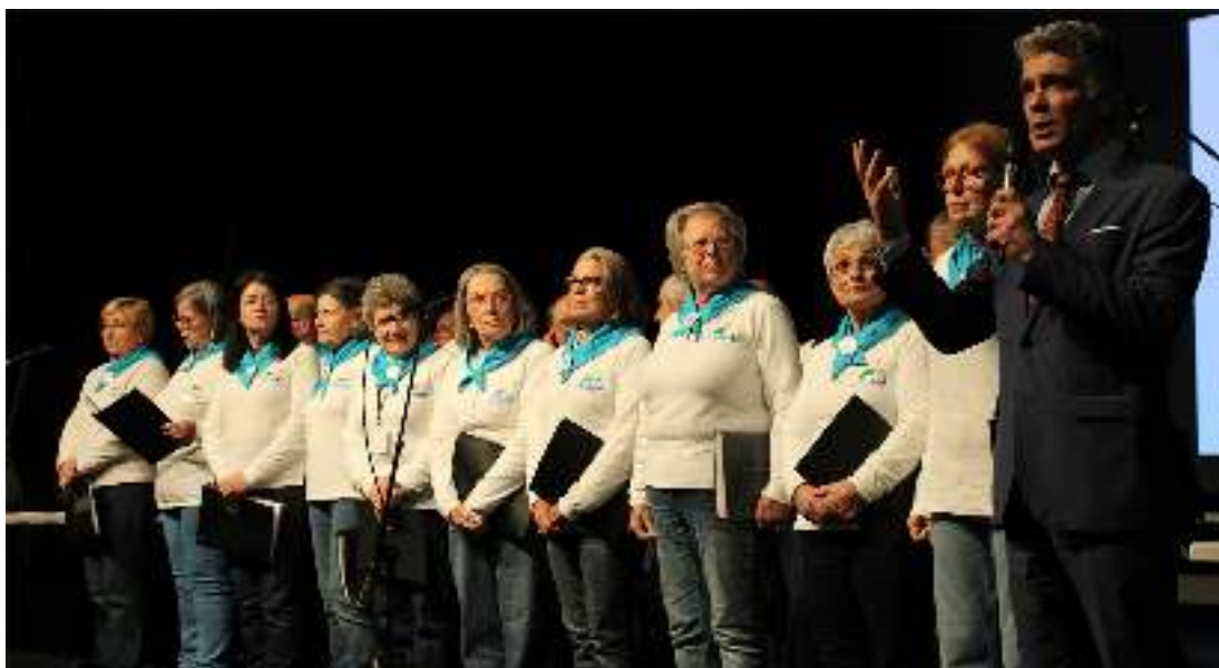
Concurso Nacional de Cultura Geral. Intervenção do Presidente da Câmara de Valongo.