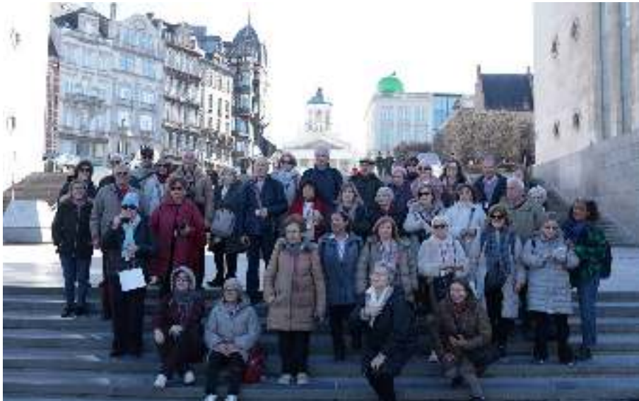
Centro de Bruxelas.

O grupo visitou ainda a Casa da História Europeia e percorreu o centro histórico, com passagem pela Grand Place, classificada como Património Mundial, pelo Manneken Pis, pela igreja de Notre-Dame du Sablon e pela Catedral de São Miguel e Santa Gudula.