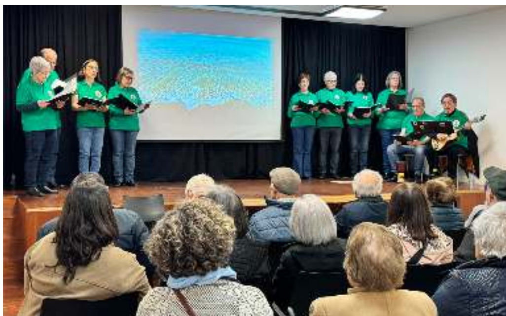
Poesia dando voz a alguns dos mais relevantes nomes da cultura portuguesa.

Mais do que um simples espetáculo, “Azul e Lágrimas” constituiu uma verdadeira celebração da identidade cultural portuguesa, evocando o mar como elemento estruturante da história e da imaginação coletiva. Num contexto particularmen-