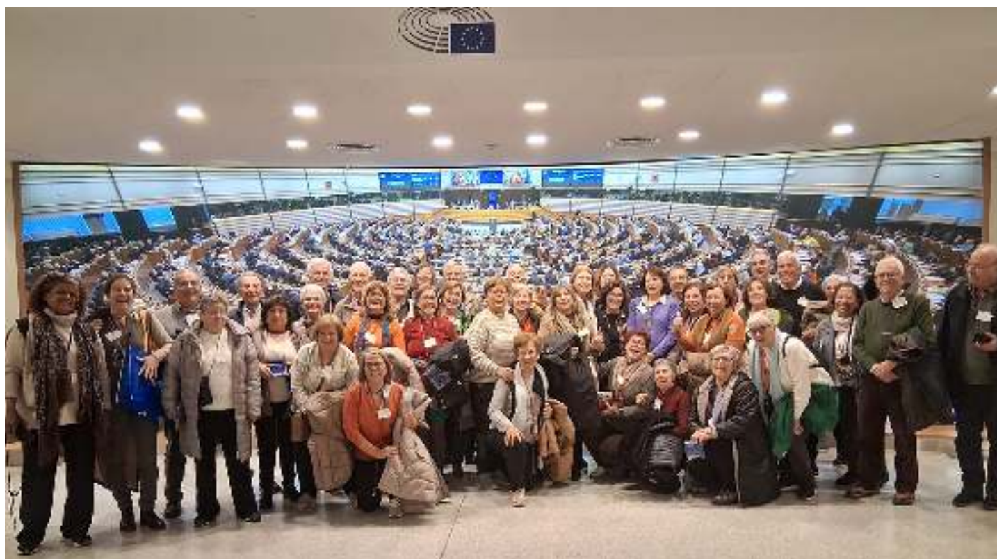
Universidade Sénior de Ermesinde no Parlamento Europeu.