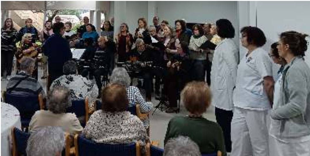
Cantigas no Centro Social de Ermesinde.

A vertente social desta iniciativa esteve bem patente na atuação no Centro Social de Ermesinde, no Lar de S. Lourenço, dia 12 de janeiro. Mais de meia centena de utentes assistiram com entusiasmo ao programa apresentado, que incluiu Janeiras de várias regiões do país. Houve aplausos, sorrisos e até quadras improvisadas pelos próprios residentes, num encontro que reforçou laços e levou conforto emocional a todos os presentes.